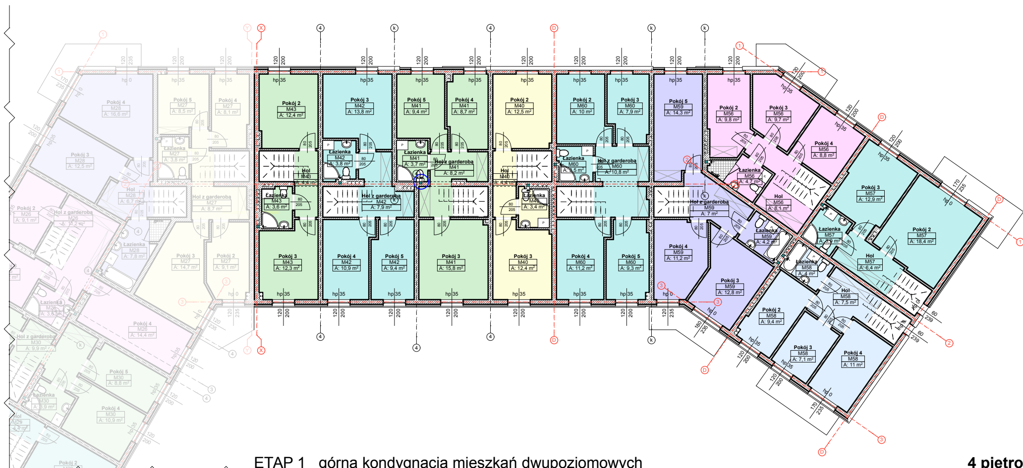
ETAP 1 górna kondygnacja mieszkań dwupoziomowych